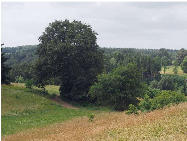
Auf dem Weg zur ...