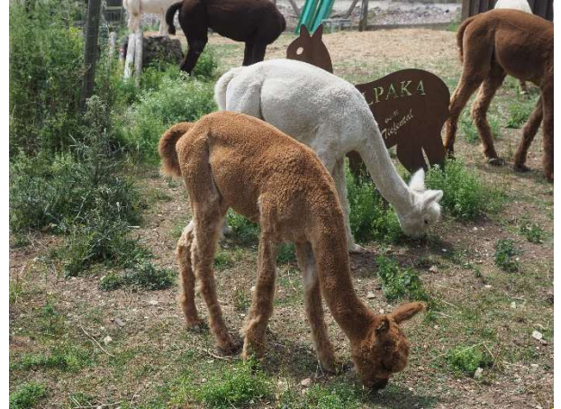
auf einer Alpakafarm