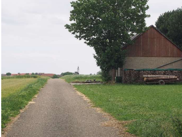
Das Ziel rückt ins Blickfeld