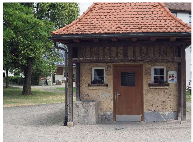
Backhaus in Heroldstatt