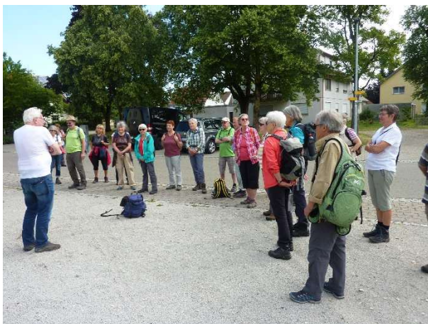
Aufbruch beim ....