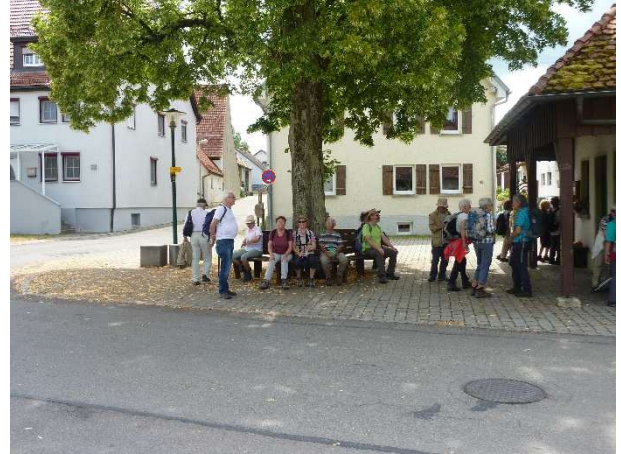
Warten auf den Bus in Seißen