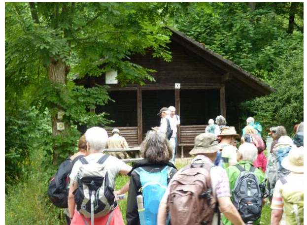
Rast an der Baasennase